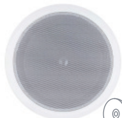
> GAT-601 6 1/2"