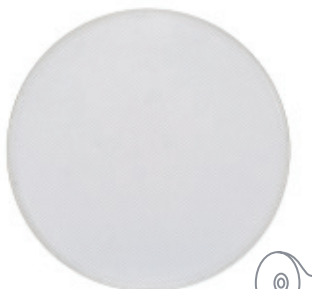
> GAT-4620 6 1/2"