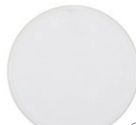
> GAT-4510 5"