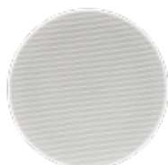
> GAT-4507 6"