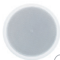
> GAT-501 5"