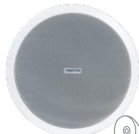
> GAT-801 8"