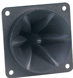
FSN-1005 Montaje por dentro